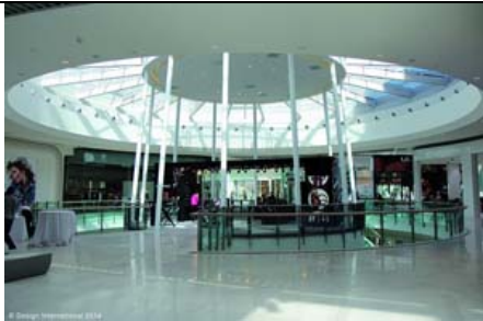
Foto 2 Centro Commerciale Nave de Vero - Interno