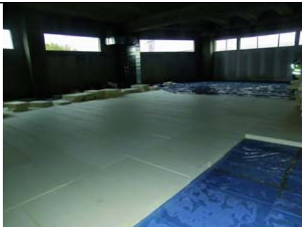
Foto 3 Isolamento dei solai e degli interpiano con pannelli STIFERITE Class SH