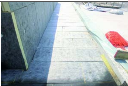
Foto 4 Isolamento della copertura con pannelli STIFERITE Class BH